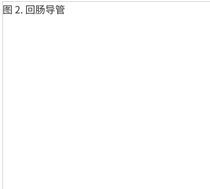
图 2. 回肠导管

手术结束后，您的尿液将从肾脏流经输尿管和回肠导管，然后从造口排出。您将在造口处佩戴一个泌尿造口袋系统（器具）来收集和容纳尿液。