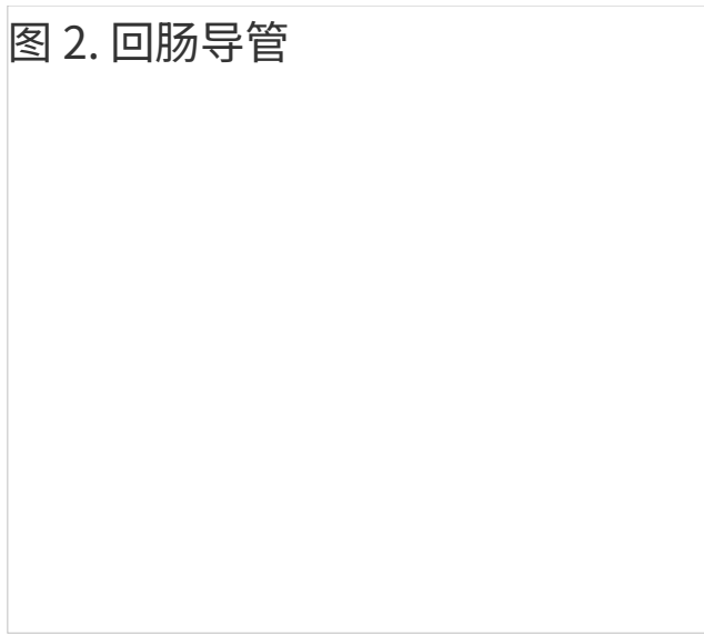
图 2. 回肠导管

手术结束后，您的尿液将从肾脏流经输尿管和回肠导管，然后从造口排出。您将在造口处佩戴一个泌尿造口袋系统（器具）来收集和容纳尿液。