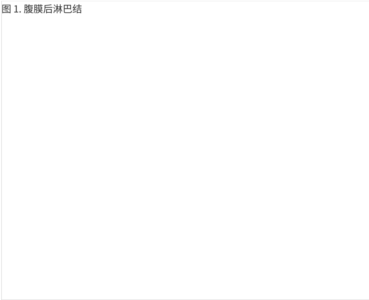
图 1. 腹膜后淋巴结