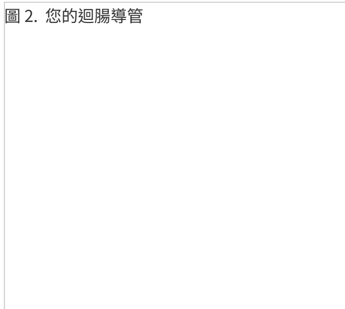
圖 2. 您的迴腸導管

手術後，您的尿液將從腎臟流出，通過輸尿管和迴腸導管，然後從造口排出。您將在造口上佩戴造口袋系統（器具）以承載尿液。