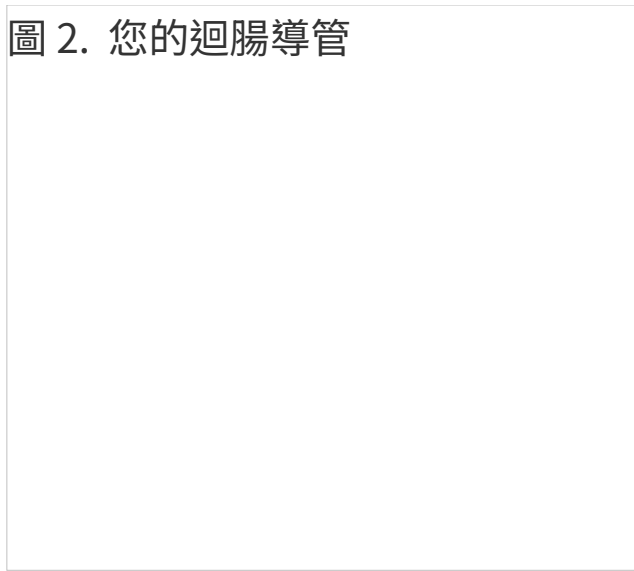
圖 2. 您的迴腸導管

手術後，您的尿液將從腎臟流出，通過輸尿管和迴腸導管，然後從造口排出。您將在造口上佩戴造口袋系統（器具）以承載尿液。