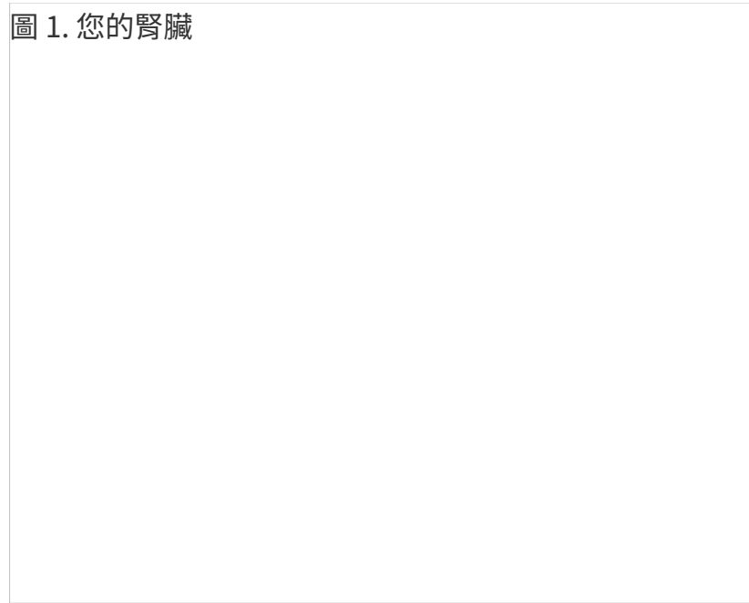
圖 1. 您的腎臟