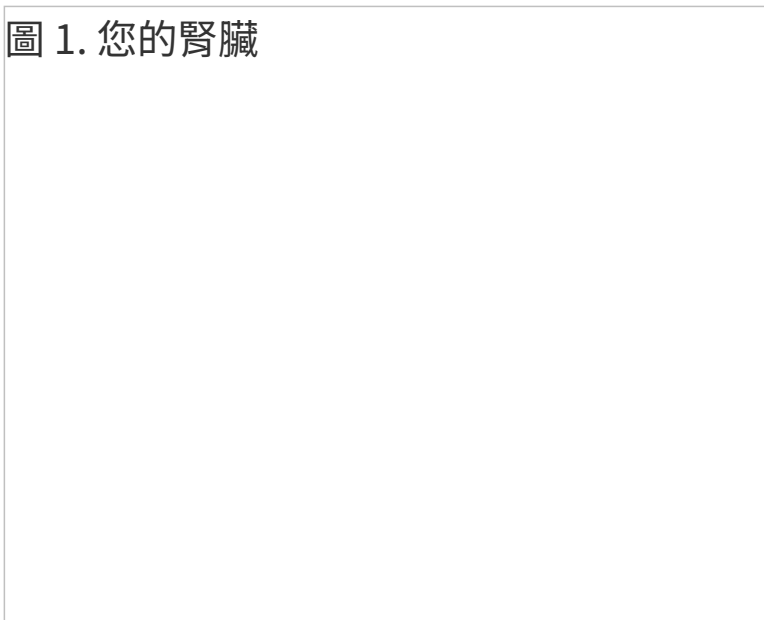
圖 1. 您的腎臟